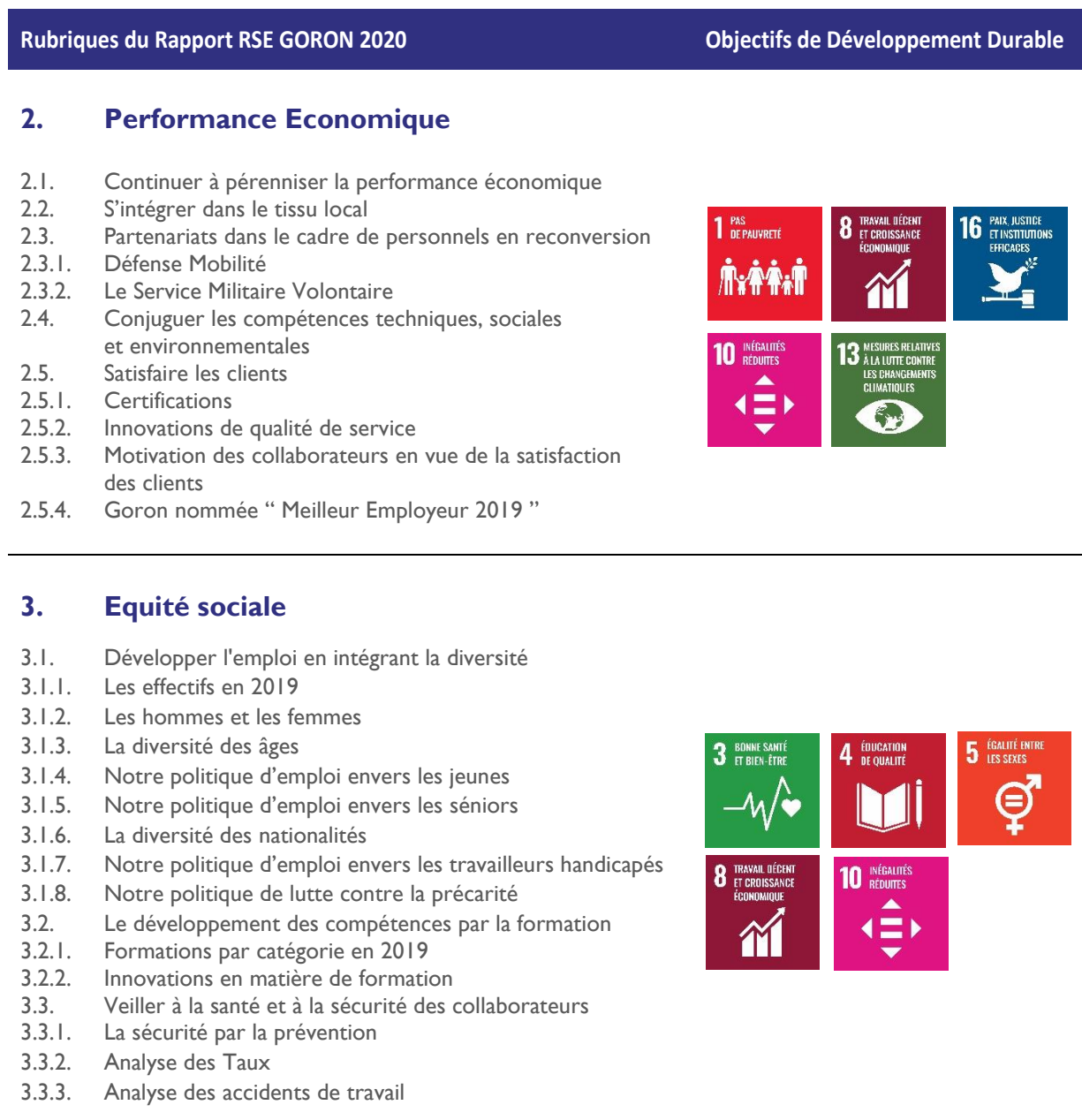
Tableau de correspondance 2020 - 2021